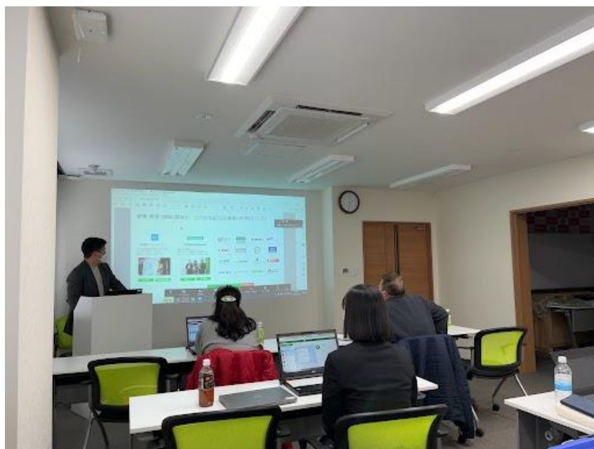
(2023年1月27日のセミナーの様子。場所：エイデイケイ富士システムDXセンター)